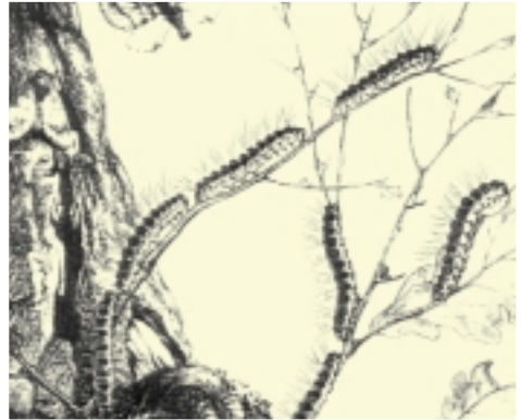
Illustratie: Naar Lampert, 1907

De rups verdwijnt met de verpopping. Vanaf dit ogenblik is het gevaar geweken. De volwassen nachtvlinder is onopvallend grijs. Hij verschijnt vanaf eind juli en kan tot eind augustus voorkomen.